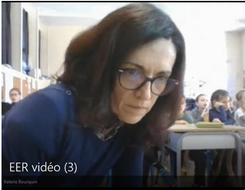
EER vidéo (3)